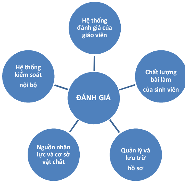
Hình 3: Mô hình đánh giá chất lượng từ bên ngoài (External Verification)